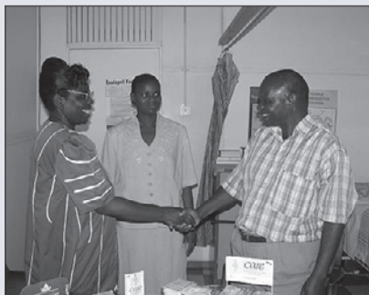
Au Zimbabwe, il est plus rentable de référer les malades aux services de traitement des ISTs et de planification familiale préexistants.

Les services d'IST et de PF n'ont pas été commercialisés sous NS+. Les clients apprenaient l'existence des services de NS+ par l'intermédiaire du réceptionniste et du conseiller lors des séances de conseil pré et post-test de dépistage. Si les clients indiquaient la présence d'IST récentes, ils étaient envoyés dans d'autres cliniques NS+. Les clients qui faisaient part de leur besoin en services de PF étaient également envoyés dans d'autres centres.